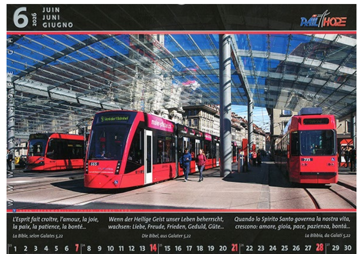
Image pour le mois de juin 2026 : l'arrêt des trams de Bernmobil à la gare de Berne avec un contraste de lumière sous le baldaquin (inauguré en 2008) et le temple du Saint-Esprit (inauguré en 1729) au fond à gauche.

voit (partiellement) le temple du Saint-Esprit à travers le baldaquin. • ( septembre ) le passage d'un train de marchandises de transit du BLS à Brugg (AG) avec un arc-en-ciel à l'arrière-plan. • ( octobre ), l'image historique du calendrier avec un train à vapeur du DFB (ligne sommitale de la Furka) circulant entre Nätschen et Oberalp-pass (UR) sur la ligne du MGB (Matterhorn Gotthard Bahn). • ( décembre ) un paysage enneigé (durant l'hiver 2023/24) avec le passage d'une rame Giruno des CFF circulant en trafic international ; à droite, la célèbre église de Wassen (UR) dédiée à saint Gall.