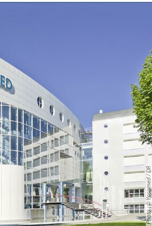
Le siège de Swatch Group à Bienne (BE) à gauche, et celui d'Ypsomed à Berthoud (BE) à droite.