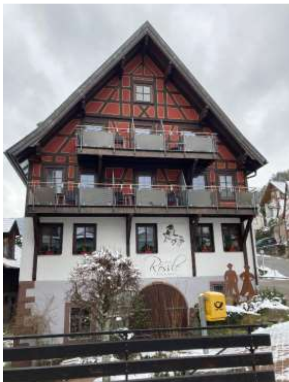
Le Rössle en hiver. En été, il sera garni de pétunias mauves et de de géraniums blancs et rouges.